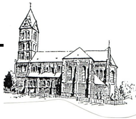
St. Magdalena Lütgendortmund Limbecker Str. 35

Der Evang. Kirchenkreis und die Kath. Stadtkirche Dortmund blicken zurück auf 25 Jahre ökumenische Zusammenarbeit zu Gunsten von Menschen in plötzlichen Krisensituationen. Seit 1994 besteht die Notfallseelsorge Dortmund. Zur Reihe der Feierlichkeiten gehört auch der „Sonntag der Notfallseelsorge“: Am 9. Februar sind alle evangelischen und katholischen Kirchengemeinden im Kirchenkreis und im Dekanat Dortmund aufgerufen, im Gottesdienst die Notfallseelsorge zum Thema zu machen. Passend soll auch die Kollekte der Notfallseelsorge gewidmet sein. Die Kollekte ist bestimmt für die Arbeit der Notfallseelsorge und ihre Ausstattung.