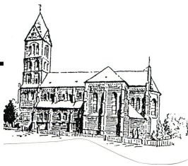
St. Magdalena Lütgendortmund Limbecker Str. 35

Bitte melden Sie sich bis zum 29. Mai im Gemeindebüro der Ev. Christus-Kirchengemeinde in Lütgendortmund, Westricher Str. 15, Tel. 63 24 16, buero-luedo@christusgemeinde-dortmund.de . Sie bekommen dann rechtzeitig Ihre beiden Tischnummern mitgeteilt. Sollten die 100 Tische nicht ausreichen, ist Ihre Kreativität gefragt und Ihr Stehvermögen, denn dann gibt es zusätzlich eine Stehparty. Und bei schlechtem Wetter? Sollte das Wetter zu schlecht sein für die Tischaktion, werden wir Sie auf der Homepage der Christus-Kirchengemeinde am Morgen des 21. Juni darüber informieren.